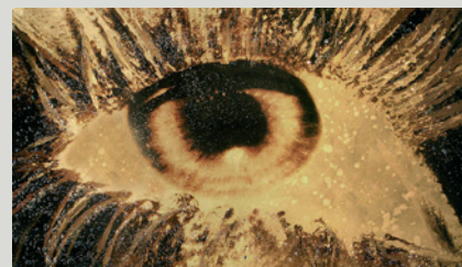
*FLOW* FASHION PANEL , 140X80 CM

Alex Turco è un artista conosciuto a livello internazionale. Oltre ad avere showrooms per le sue collezioni in tutto il globo, ha realizzato opere personalizzate per importanti personaggi del mondo della moda, spettacolo, sport, etc. L'artista usa per i suoi "panels" e complementi di arredo un'inedita tecnica mista frutto di una costante ricerca ed innovazione, in cui entrano in gioco fotografia, grafica, pittura e successiva elaborazione manuale con applicazione di materiali innovativi (resine, vetri, metalli, pietre). Il risultato è una sorprendente valorizzazione di ambienti interni, seguendo il principio di coerenza, armonia e complementarietà di stile. La sua visione è "trasportare e fondere l'arte nel design".